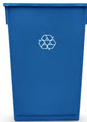
23-GALLON SLIM 31" H