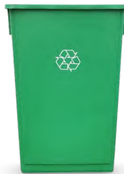
23-GALLON SLIM 31" H