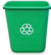
7-GALLON DESKSIDE 15" H