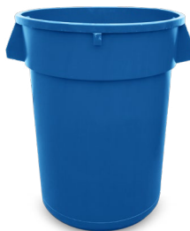
20-GALONES REDONDO CON TAPA 23" H