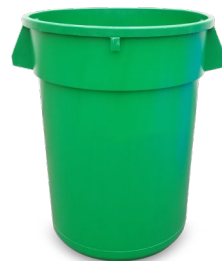
32-GALLONES REDONDO CON TAPA 28" H