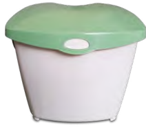
3-GALLON COUNTERTOP PAIL