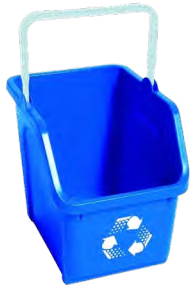
6-GALLON BASKET 15" H