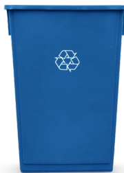
23- GALONES 31" H