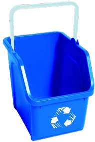
CANASTA DE 6-GALONES 15" H