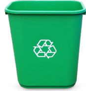
7-GALONES 15" H