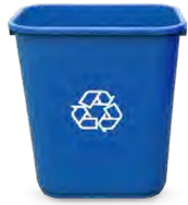
7-GALLON DESKSIDE 15" H

Republic Services offers interior recycling and organics collection containers (supplied by RecycleMore) at no additional cost to your waste bill. To request containers for your business, call 510.262.7140 or email recyclingcoordinators@RepublicServices.com .