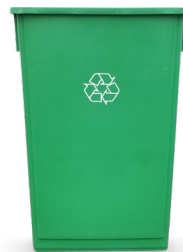
23- GALONES 31" H