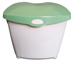
CUBETA DE 3-GALONES