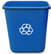
7-GALONES 15" H

Republic Services ofrece contenedores interiores para recolectar el reciclaje y el material orgánico (suministrados por RecycleMore) sin costo adicional a su factura de basura. Para solicitar contenedores para su negocio, llame al 510.262.7140 o envíe un correo electrónico a recyclingcoordinators@RepublicServices.com .